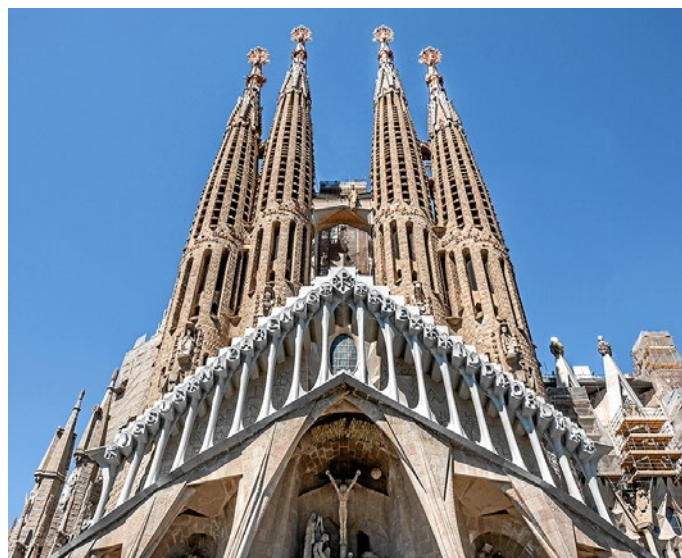
Imatge de la Sagrada Família, un dels símbols de Catalunya.

En aquests moments els catòlics hauríem de saber aportar a la convivència els nostres millors valors: el respecte per les opinions lícites dels que pensen diferent de nosaltres. No parlo només de tolerància. Tolerància vol dir això: suportar. Tolerem una càrrega, o una situació adversa, o moltes coses que no ens agraden. Parlo